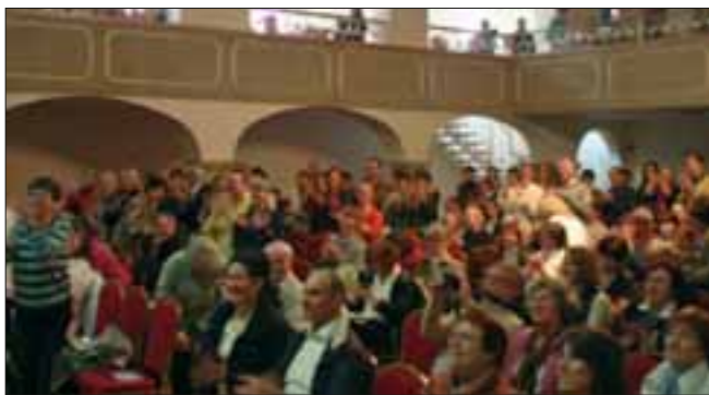
3. Internationaler Kongress für Theomedizin®