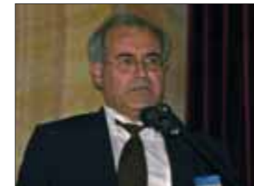
Wadim Säidow (Physiker)

In jedem Forschungszweig, der noch relativ jung ist, der sich aber stetig etabliert, kommt es zu einem Prozess, in dem sich seine Grundlagen in der Öffentlichkeit verbreiten und nach und nach angenommen werden. Um diesen Prozess zu unterstützen, wurde die Fördergemeinschaft gegründet.